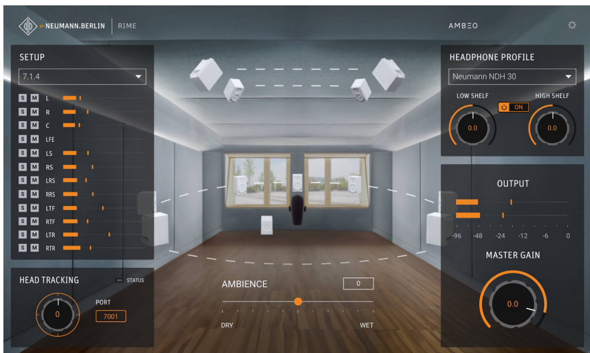
Neumanns nieuwe DAW plug-in RIME (Reference Immersive Monitoring Environment)

Neumann geeft een avant-première van een gloednieuw product dat later in april gelanceerd zal worden: RIME - Reference Immersive Monitoring Environment . RIME is een DAW plug-in (VST3, AU, AAX) die gebruikers de mogelijkheid geeft om immersieve formaten zoals Dolby Atmos 7.1.4 te monitoren via een hoofdtelefoon met gebruik van de revolutionaire AMBEO-algoritmes. In tegenstelling tot bestaande oplossingen is RIME specifiek gemaakt voor Neumann NDH 20- en NDH 30-hoofdtelefoons. Eigenlijk omvat de software een volledige Neumann-signaalketen van KH-luidsprekers, perfect uitgelijnd via MA 1 in een referentieruimte, opgenomen met behulp van de KU 100 binaurale kop via de MT 48. Dus in combinatie met de Neumann-hoofdtelefoons strekt deze onberispelijke signaalketen zich helemaal tot bij de gebruiker uit. Het resultaat is een nooit eerder gehoorde helderheid en precisie. RIME kan ook gebruikt worden voor het externaliseren van stereoweergave, zodat hoofdtelefoons klinken als studiomonitors.