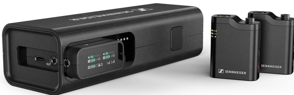
Profile Wireless is een tweekanaals alles-in-één clip-on en handheld microfoonsysteem

Ook de smalband digitale oplossingen van het bedrijf zullen te zien zijn, namelijk Digital 6000 en EW-DX met de nieuwe vierkanaals Dante-ontvanger, net als Sennheisers omroepmicrofoons, waaronder een gloednieuw topmodel dat onthuld zal worden op NAB . Voor contentcreators zal Sennheiser de Profile Wireless alles-in-één microfoonoplossing tonen.