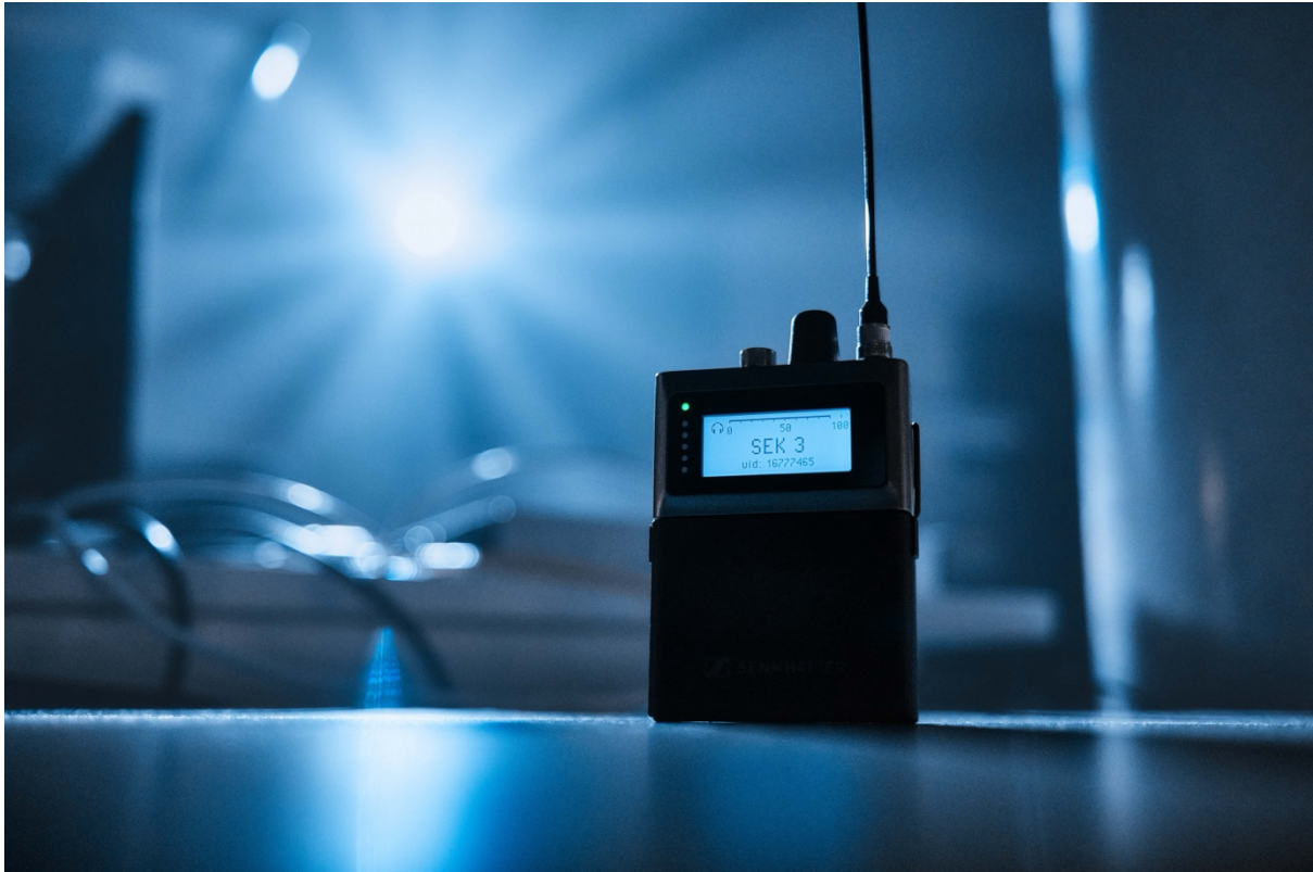
Het bidirectionele bodypack van Sennheisers Spectera breedband draadloos ecosysteem

Ook de smalband digitale oplossingen van het bedrijf zullen te zien zijn, namelijk Digital 6000 en EW-DX met de nieuwe vierkanaals Dante-ontvanger, net als Sennheisers omroepmicrofoons, waaronder een gloednieuw topmodel dat onthuld zal worden op NAB . Voor contentcreators zal Sennheiser de Profile Wireless alles-in-één microfoonoplossing tonen.