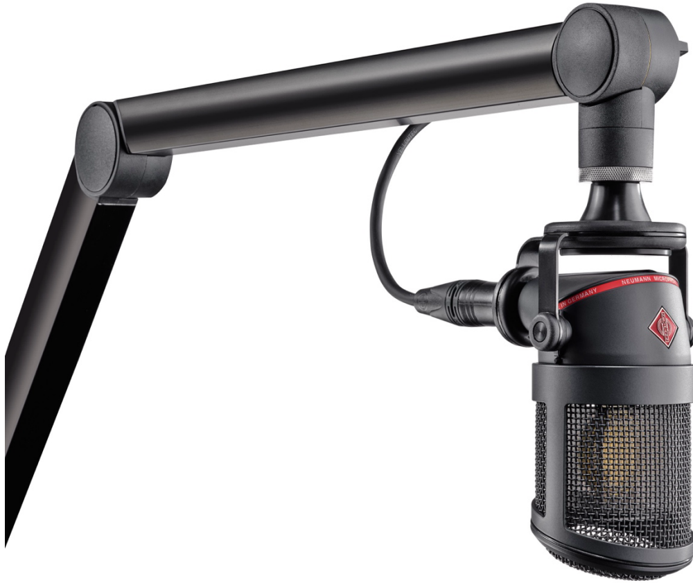
De Neumann BCM 104 mt